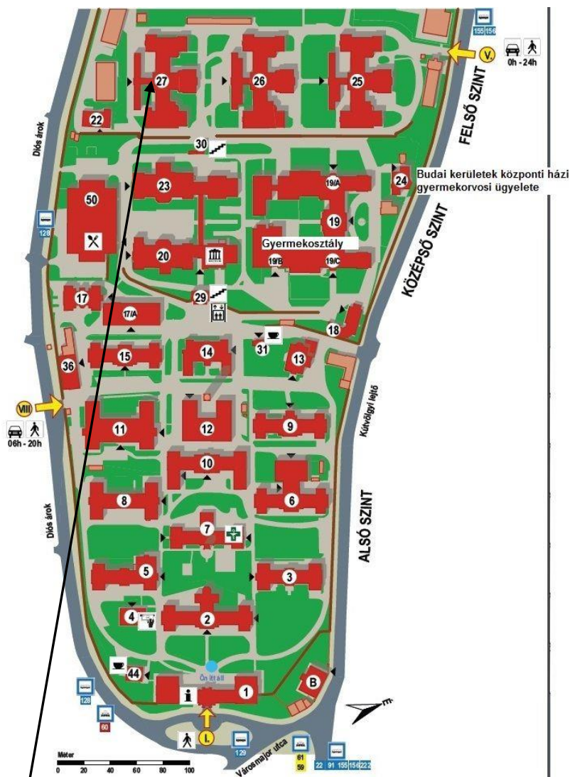
Szent János Kórház belső térképe (27-es számú épület a Pulmonológiai Klinika)

- Kocsival: Széll Kálmán tér felől a Szilágyi Erzsébet fasoron át a János Kórházig kell jönni. A Pulmonológiai Klinika a Szent János főbejáratától 5-10 perc sétára van, egyenesen fel kell sétálni a legmagasabb pontig (közben két lépcsőházon kell átmenni), majd bal oldalon lesz található a Klinika, a Traumatológia épülete mellett.