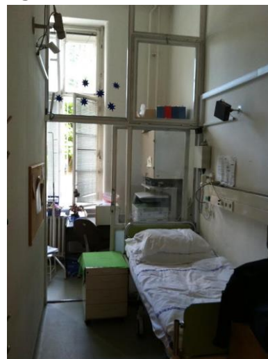
Az alvásvizsgálat szobája